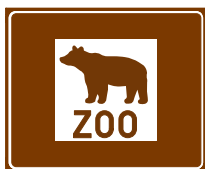
772 e. Eläintarha tai -puisto