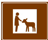
774 e. Kotieläinpiha