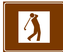
773 d. Golfkenttä