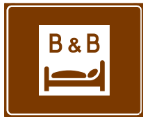
774 b. Aamiaismajoitus