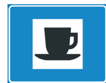
725. Kahvila tai pika- ruokapaikka