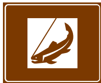
773 b. Kalastuspaikka