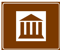
772 a. Museo tai historiallinen rakennus