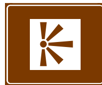
772 d. Näköalapaikka