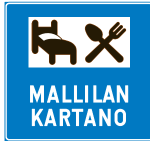
701. Palvelukohteen opastustaulu