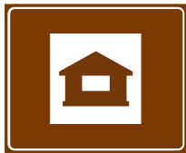
774 a. Mökki-majoitus