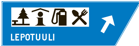
703. Palvelukohteen erkanemisviitta