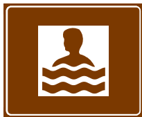
773 a. Uintipaikka