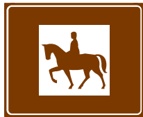
774 f. Ratsastuspaikka