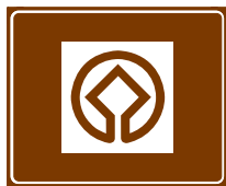
772 b. Maailmanperintökohde