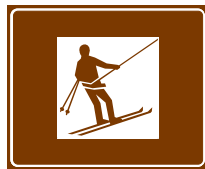
773 c. Hiihtohissi