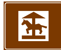
773 e. Huvi- tai teemapuisto