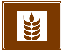
774 c. Suoramyynti