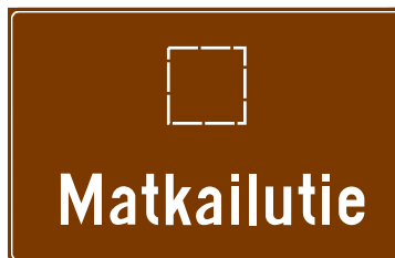
771 b. Matkailutie