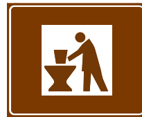
774 d. Käsityöpaja