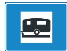
734. Matkailuajo- neuvoalue